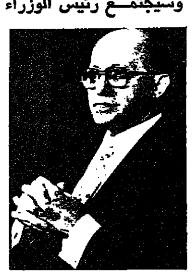
خلال هذه الزيارة مع الرئيس الاميركي جيمي كارتر بعد غد الثلاثاء ويبحث معه بعض

القدس - غادر البلاد الليلة الماضية السيد منحيم بيغن رئيس الوزراء في زيارة خاصة الى الولايات المتحدة تستغرق 10 ايام للاشتراك في الاحتفالات التي تجري في بعض المدن الاميركية بمناسبة الذكرى المئوية لميلاد زئيف جيتوتسكي زعيم الحركة الصهيونية الاصلاحية وسيجتمع رئيس الوزراء